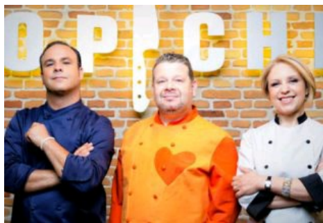
Los jueces del programa 'TopChef'. Antena 3

"Saber qué pasa en cada momento, si se generan conversaciones entre usuarios, quién actúa como punto de conexión entre comunidades de usuarios, cuál es la distancia entre usuarios o cuál es el camino más fácil para llegar al emisor clave resulta fundamental para conseguir nuestros